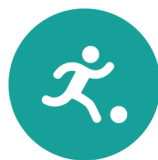
Spel en beweging/ bewegingsonderwijs